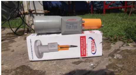
Gambar 2. Low Noise Block

Pada stasiun bumi yang digunakan untuk satu arah yang sering digunakan untuk menerima siaran televisi ataupun sebagai radio, perangkat - perangkat nya terdiri dari antena reflector , Low Noise Block (LNB) , kabel coaxial . Antena berfungsi menerima sinyal berupa gelombang elektromagnetik yang bermodulasi RF dari satelit. Low Noise Block (LNB) berfungsi menerima gabungan sinyal yang dipantulkan dari piringan/ dish .