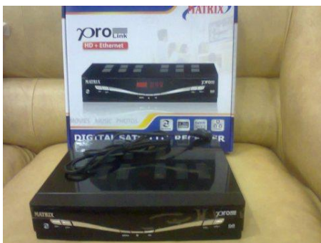
Gambar 3. DVB-S2

Kelebihan DVB-S2 adalah pada sisi kapasitasnya yang lebih besar, hingga 30 % lebih baik dari pada DVB-S. DVB-S2 juga sangat flexible dan dapat bekerja pada transponder seperti apapun. DVB-S2 tidak hanya terbatas pada MPEG-2 melainkan dapat menangani format audio dan video yang lebih maju seperti MPEG-4.