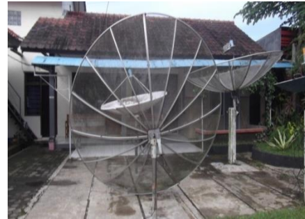
Gambar 4.. Antena Parabola

transmisi terdapat dua Antena, yaitu antena pengirim ( Tx ) dan antena penerima ( Rx ). Fungsi dari Antena pengirim yaitu memancarkan serta merubah gelombang elektromagnetik terbimbing menjadi gelombang elektromagnetik ruang bebas. Sedangkan Antena penerima berfungsi menerima serta merubah gelombang elektromagnetik ruang bebas menjadi gelombang elektromagnetik terbimbing [6] .